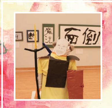
「“こころ”のふれあうフェスタ 2022 作品展」の会場の風景

「“こころ”のふれあうフェスタ 2023 作品展」は今年で第 10 回目を迎えます。宮崎県内の障がいのある方の作品を募集し、作品が持つ物語やその人らしさと一緒に感じていただけるような展示をしています。この作品展が、障がいのある方の社会参加を促すとともに、人生の豊かさや地域での生きやすさにつながるきっかけや交流の場になってほしいと考えています。その人や周りの人の思いがあふれる作品を、ぜひご覧ください。